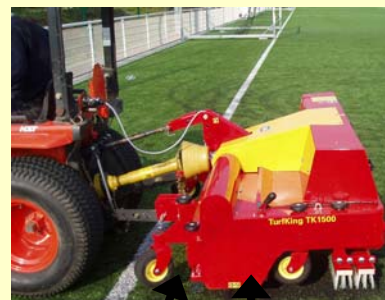
Griffe de décompactage-Brosse rotative

Comme toutes les machines de la gamme SMG, la particularité sera à nouveau le filtre à particules capable d'aspirer et de retenir les très fines pollutions responsables du colmatage et de la diminution du drainage des terrains en gazon synthétique.